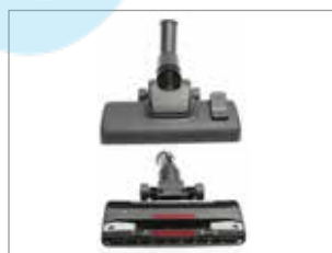
НОВА ПОТУЖНА НАСАДКА ДЛЯ ВИСОКОЇ ЕФЕКТИВНОСТІ ОЧИЩЕННЯ