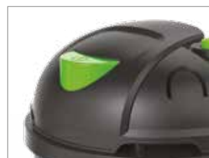
ПЕРЕМИКАЧ УВІМК./ВИМК ПІШКИ